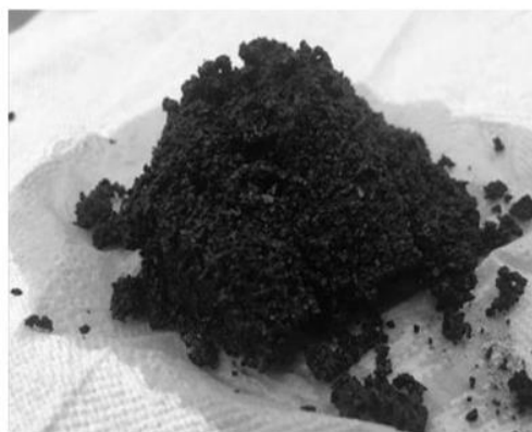
圖 2 咖啡渣