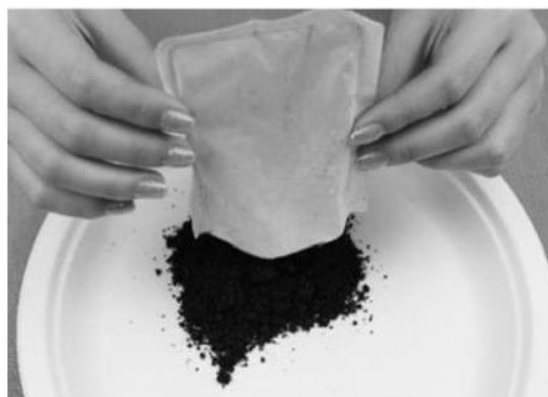
圖 1 市售暖暖包

市售暖暖包(如下圖 1 所示)中常加入蛭石,其功用為跟空氣接觸後,能快速地吸收空氣中水分,加速鐵粉的氧化速率,進而放熱達成暖暖包的效果。 小育 想要以咖啡渣(如下圖 2 所示)來取代暖暖包內容物—蛭石,以期減少廢棄量。因此進行以下兩組實驗: