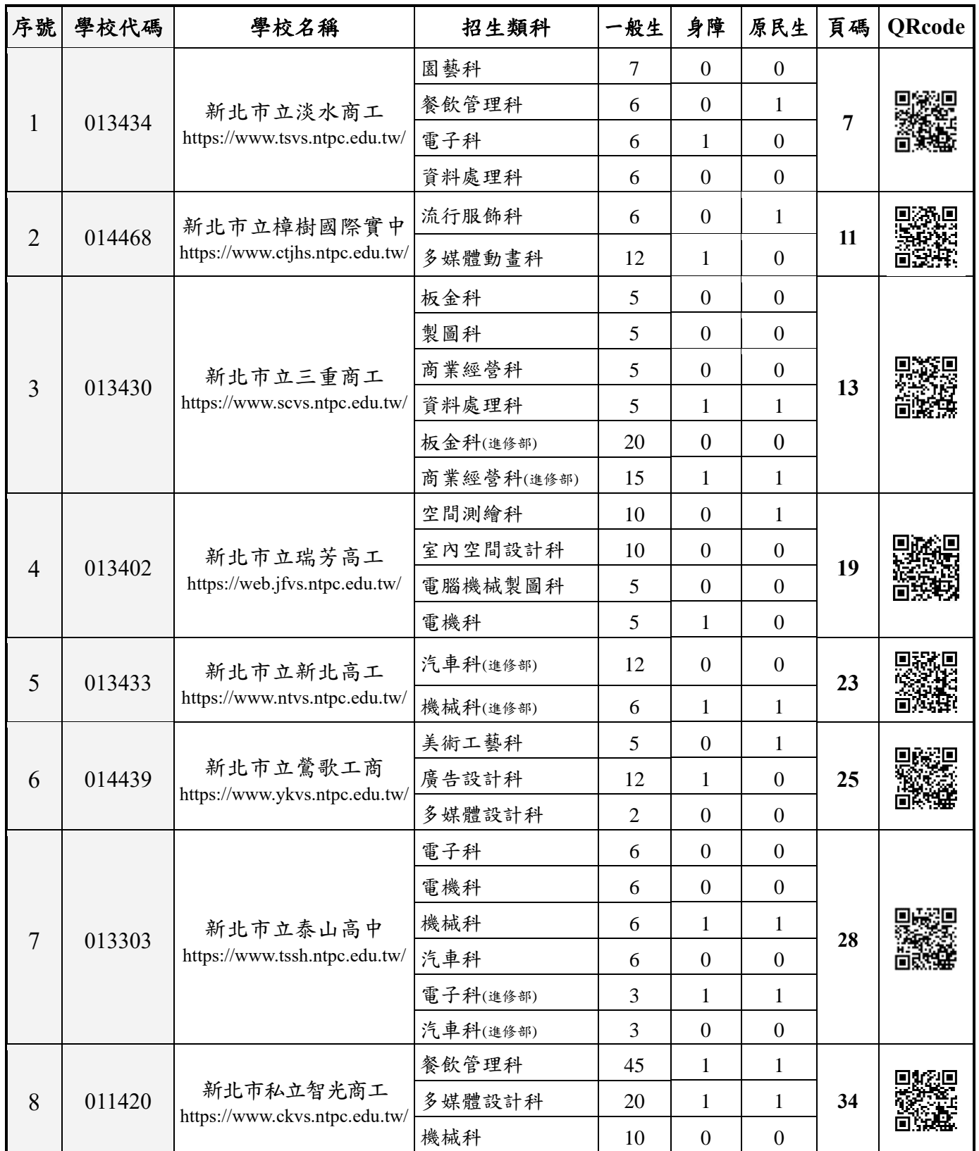
新北市 114 學年度高級中等學校特色招生專業群科甄選入學招生學校一覽表