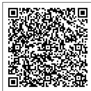
碇內國中-職探中心 FB

***本校辦理教育儲蓄專戶業務，長時間協助學生穩定就學，有捐款意願的家長可聯絡輔導主任。